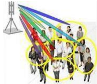
Snopovi od 5G baznih stanica

Svaka će 5G bazna stanica sadržavati stotine ili tisuće antena koje će istovremeno usmjeravati višestrukе snopove, nalik laserskim zrakama, prema svim mobilnim i korisničkim uređajima u svom području pokrivanja. Ova tehnologija naziva se "višestruki ulaz višestruki izlaz" ili MIMO. FCC pravila dopuštaju da efektivna izračena snaga snopa 5G bazne stanice bude do 30.000 wata po 100 MHz spektra 2 ili ekvivalentno 300.000 wata po GHz spektru, što je desetke do stotina puta jače od razina dopuštenih za sadašnje bazne stanice.